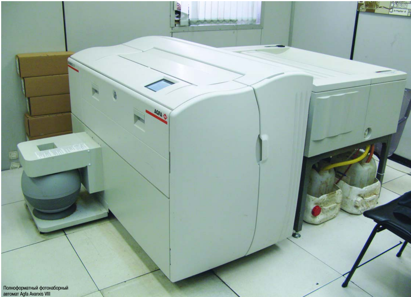
Полноформатный фотонаборный автомат Agfa Avanxis VIII