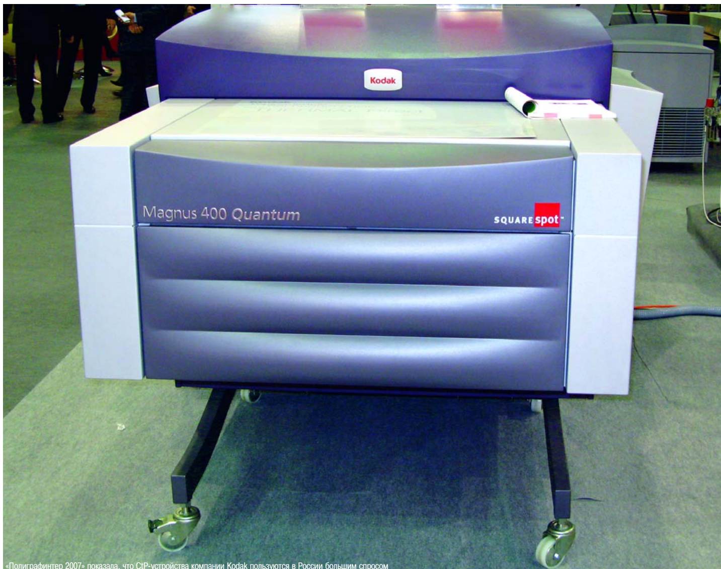
«Полиграфинтер 2007» показала, что CtP-устройства компании Kodak пользуются в России большим спросом

- Какова динамика вывода фотоформ и CtP-форм в вашем бюро за прошлый год?